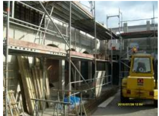
Der Umbau beginnt

An 254 Tagen im Jahr präsentierte das Forum Baltikum - Dittchenbühne öffentliche Veranstaltungen, die ehrenamtlich durchgeführt wurden. Neufeldt hob besonders das Kindertheater der Dittchenbühne hervor, das mehr als 3250 Besucher beim Weihnachtsmärchen hatte.