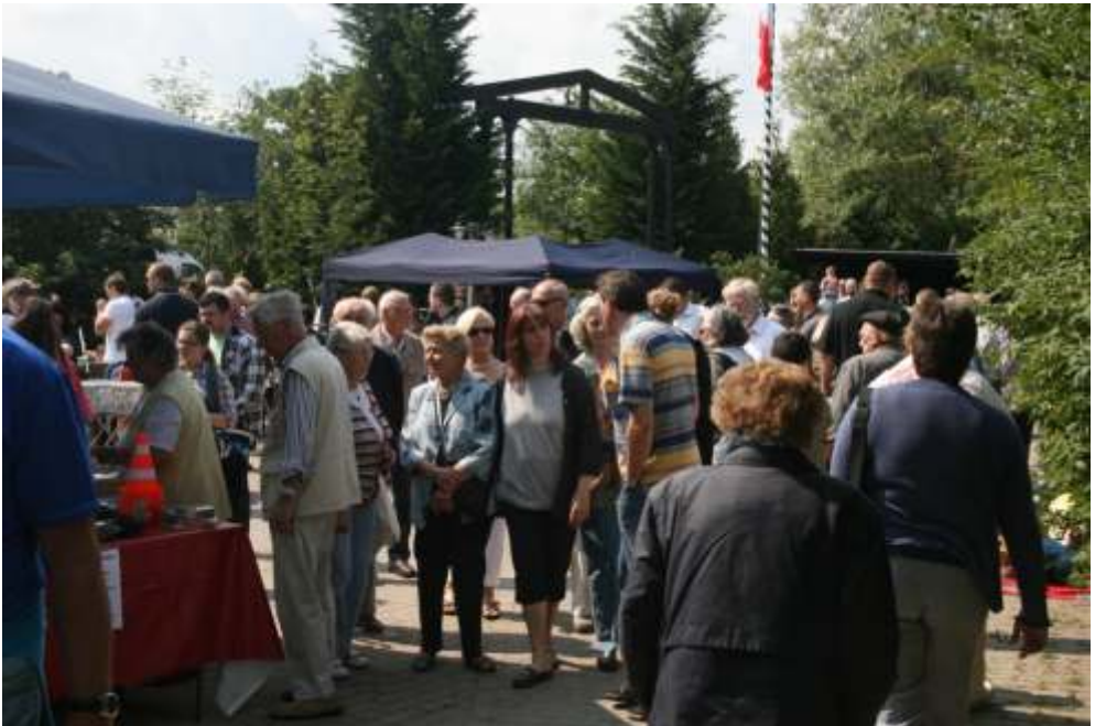
Flohmarktstände werden gut angenommen

Auf den Flohmarktstischen: Handwerkzeug, Gemälde, Poster, Brettspiele, Spargelschäler, Zeug für Jung und Alt, Bücher, Vasen, Krüge, Geschirr, Leuchter, Elektrogeräte und vieles mehr bunt durcheinander gewürfelt. Am Losstand der Dittchenbühne lockten als Hauptgewinne Familienfreikarten für das Weihnachtsmärchen des Theaters. Der Eisstand war dank des guten Wetters stets umlagert, Grillwürste gingen gut, doch die längste Schlange hatte sich natürlich am Ochsenstand gebildet.