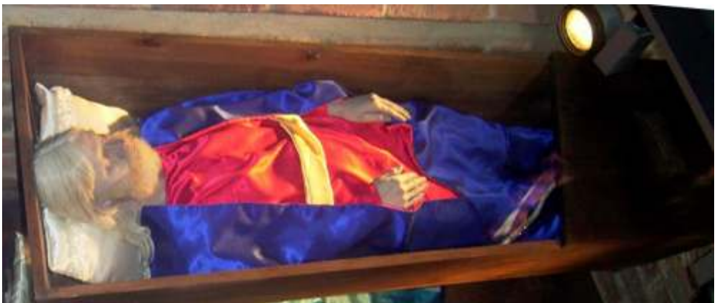
Heinrich von Plauen im Sarg, Marienwerder

Heinrich von Plauen, geb. 1370, gest. 1429, Hochmeister und Retter des Deutschen Ordens ging nach der verlorenen Schlacht von Tannenberg (1410) als heldenmütiger Verteidiger der Marienburg gegen das vereinigte Heer der Polen und Litauer in die Geschichte ein. Er wurde später vom Ordenskapitel abgesetzt, weil er dabei war, die Rechte der Ritter zu schmälern und den der preußischen Städte zu erweitern. Er starb in der Verbannung in Lochstädt/Samland und wurde in der Gruft der Domkirche von Marienwerder “nur im Schatten der Marienburg” beigesetzt. Bis zum letzten Jahr galt der Verbleib seines Sarges als verschollen. Jetzt wurde sein Grab wieder entdeckt.