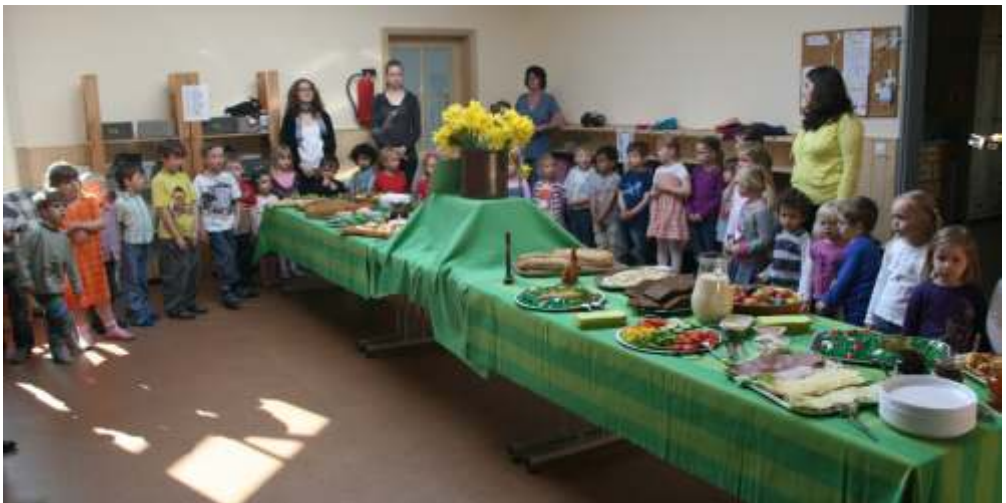
Osterfrühstück im neuen Kindergarten