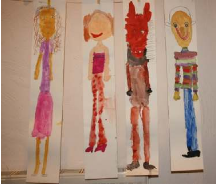
Bilder der jungen Künstler