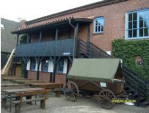
Vor dem Umbau