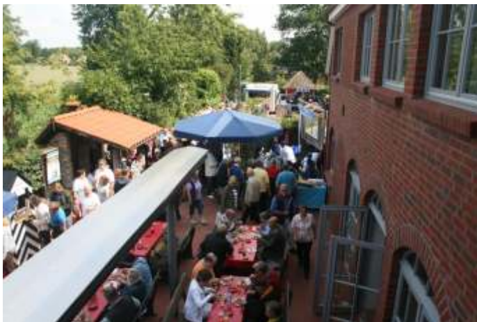
Reges Treiben im Innenhof

150 Stände einschließlich der Flohmarktstände konnten besucht werden, etwa 800 Portionen Grillochse wurden gegessen und an die 15 000 Besucher kamen laut Angabe von Dittchenbühnenchef Raimar Neufeldt auf das Festgelände an der Hermann-Sudermann-Allee: Die Pfingstveranstaltung war