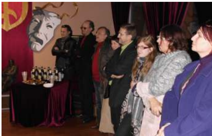
Empfang im Dramatischen Theater Klaipeda/Memel

In Königsberg gastierte die Dittchenbühne im Deutsch-Russischen Haus, auch hier gab es Vertreter des deutschen Generalkonsulates. In Memel konnte man immer noch nicht wieder im Stadttheater spielen, da dieses wegen Einsturzgefahr gesperrt ist, man hat aber schon mit den Reparaturarbeiten begonnen.