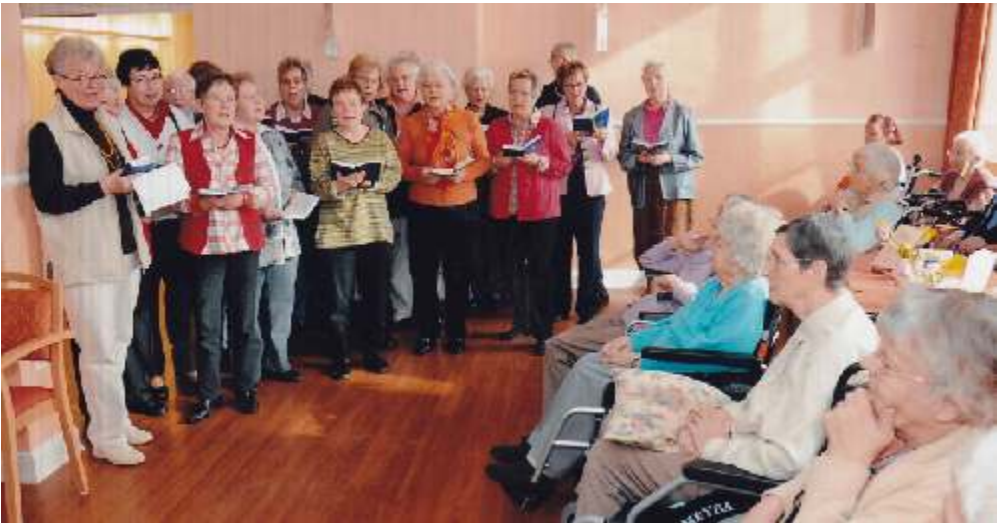
Dittchenlerchen singen in einem Seniorenheim

Neben einem gemeinsamen Mittagessen sowie Kaffee und Kuchen stand vor allem eines an diesem Tag im Vordergrund: Das gemeinsame Singen. Und so erklangen immer wieder fröhliche Lieder in der Elmshorner Dittchenbühne an der Hermann-Sudermann-Allee.