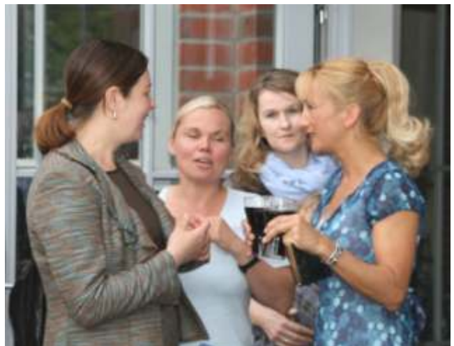
Mitarbeiterinnen des Hauses

Wie stark sich die Einrichtung verändert hat, erlebten die Gäste während einer Begehung. Der Saal wurde vergrößert, darüber entstanden zwei Unterrichtsräume mit mobiler Trennwand, ein Fahrstuhl führt barrierefrei in den ersten Stock und zu Logenplätzen, von denen sich Freiluftaufführungen verfolgen lassen. Die Dittchenbühne verfügt