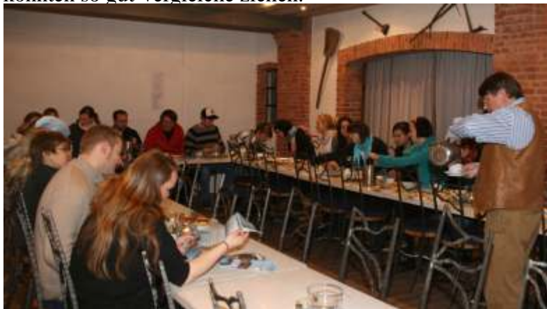
Studenten der CAU im Festsaal

Nach zwei Stunden verließen die Studenten die sozio-kulturelle Einrichtung mit überaus positiven Eindrücken. Die Besucher aus Kiel waren über die vielfältige Tätigkeit, die geringe finanzielle Förderung und das große ehrenamtliche Engagement der vielen Vereinsmitglieder überrascht. Vorher hatten sie eine ähnliche kommunale Einrichtung in Heide besucht und konnten so gut Vergleiche ziehen.