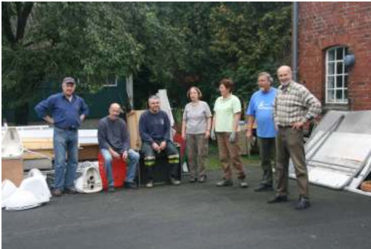
Der Vorstand wartet auf den Container

Wir sind der Meinung, dass ein Vorstand für seine Mitglieder mit gutem Beispiel vorangehen muss. Bei uns existieren keine (bekleckerten) Vereinsschlipse oder Ehrenzeichen, an denen wir uns festhalten können, - so etwas haben wir überhaupt nicht nötig, aber dafür gibt es viel Arbeit in jeder Form, die wir erledigen müssen. Wir zahlen keine Sitzungsgelder oder Aufwandsentschädigungen. Vorstandsarbeit ist bei uns tatsächlich ehrenamtlich. Ja, eigentlich müssen die Vorstandsmitglieder noch Geld mitbringen. Es gibt bei uns keine müden Beisitzer, sondern nur Mitarbeiter mit häufig wechselnden Tätigkeiten. Neben vieler bürokratischer Arbeit sind