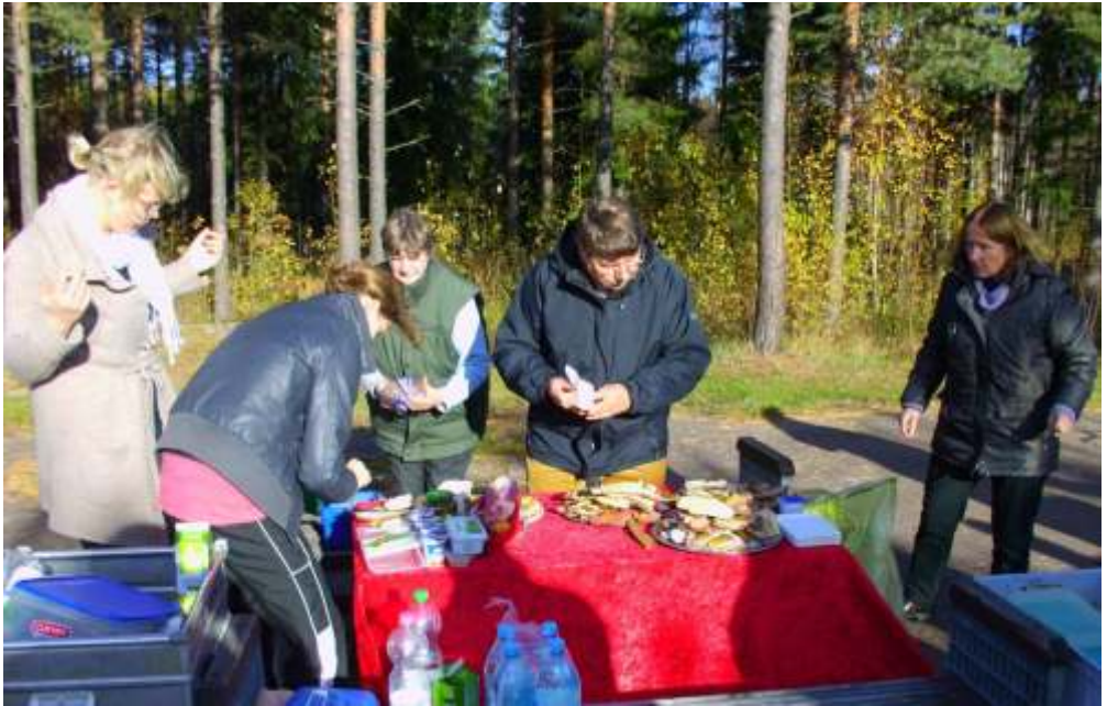
Die "Schnittchenbühne" wird vorbereitet

In Pernu/Estland eröffneten die Schauspieler eine „Deutsche Woche“, die in Zusammenarbeit mit der deutschen Botschaft durchgeführt wurde, in Tallinn spielte man in einem großen Kulturhaus vor Angehörigen der deutschen Minderheit und Germanistik-Studenten.